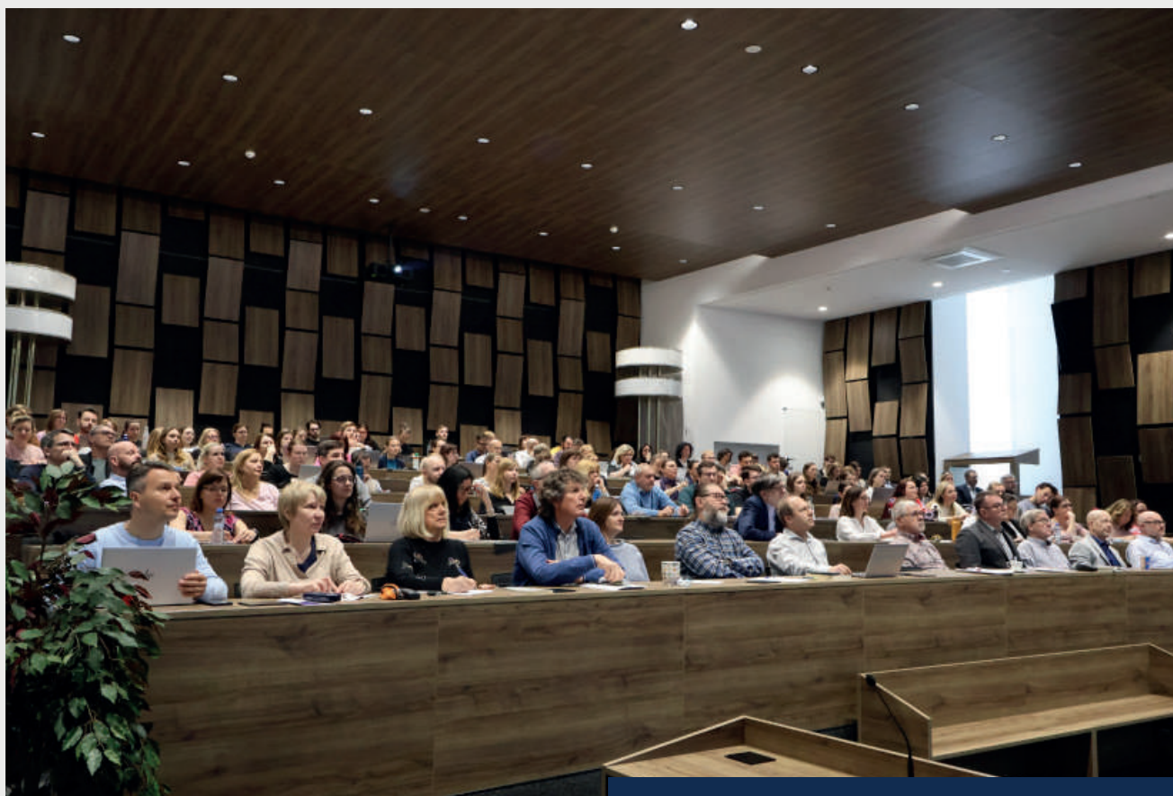
O semináře byl mezi uchazeči enormní zájem.

Druhá polovina semináře se zaměřila na meritorní usnesení a rozkazy jako je rozkaz k vyklizení. Jak psát opravná a doplňující rozhodnutí. Velká část semináře byla věnována rozsudkům, jejich jednotlivým typům a zejména pak příkladům z praxe. Závěrem se dostal na program i doručování rozhodnutí o nabytí právní moci a odkladu vykonatelnosti.