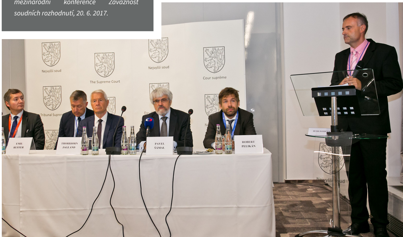
Úvodní tisková konference při příležitosti mezinárodní konference Závaznost soudních rozhodnutí, 20. 6. 2017.