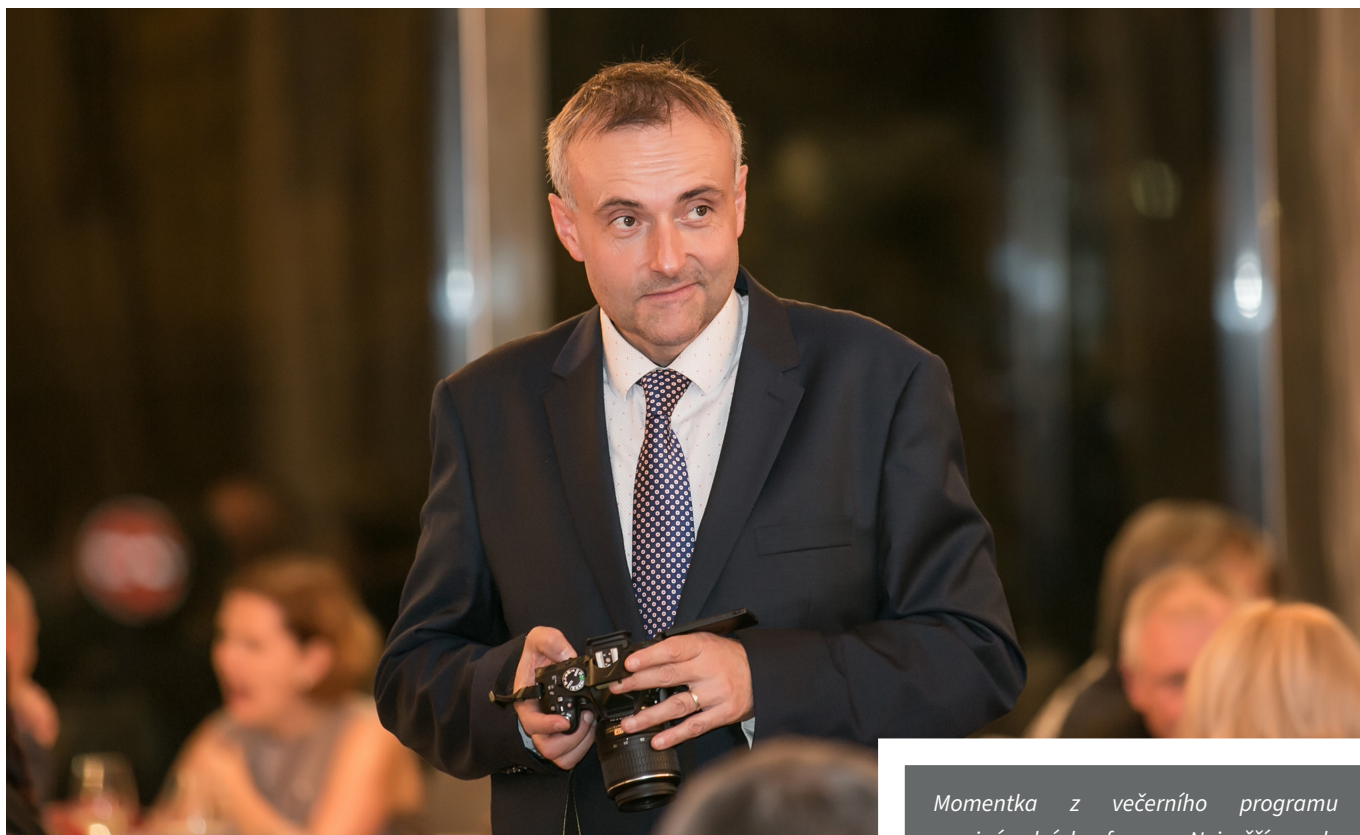
Momentka z večerního programu mezinárodní konference Nejvyšší soudy v měnící se době, 5. – 7. 11. 2018.