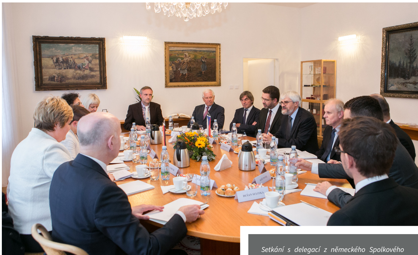
Setkání s delegací z německého Spolkového soudního dvora.