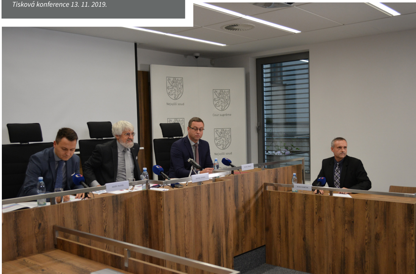
Tisková konference 13. 11. 2019.