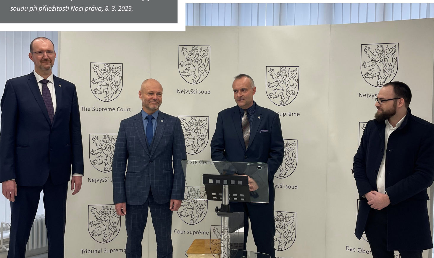
Tisková konference pořádaná v budově Nejvyššího soudu při příležitosti Noci práva, 8. 3. 2023.