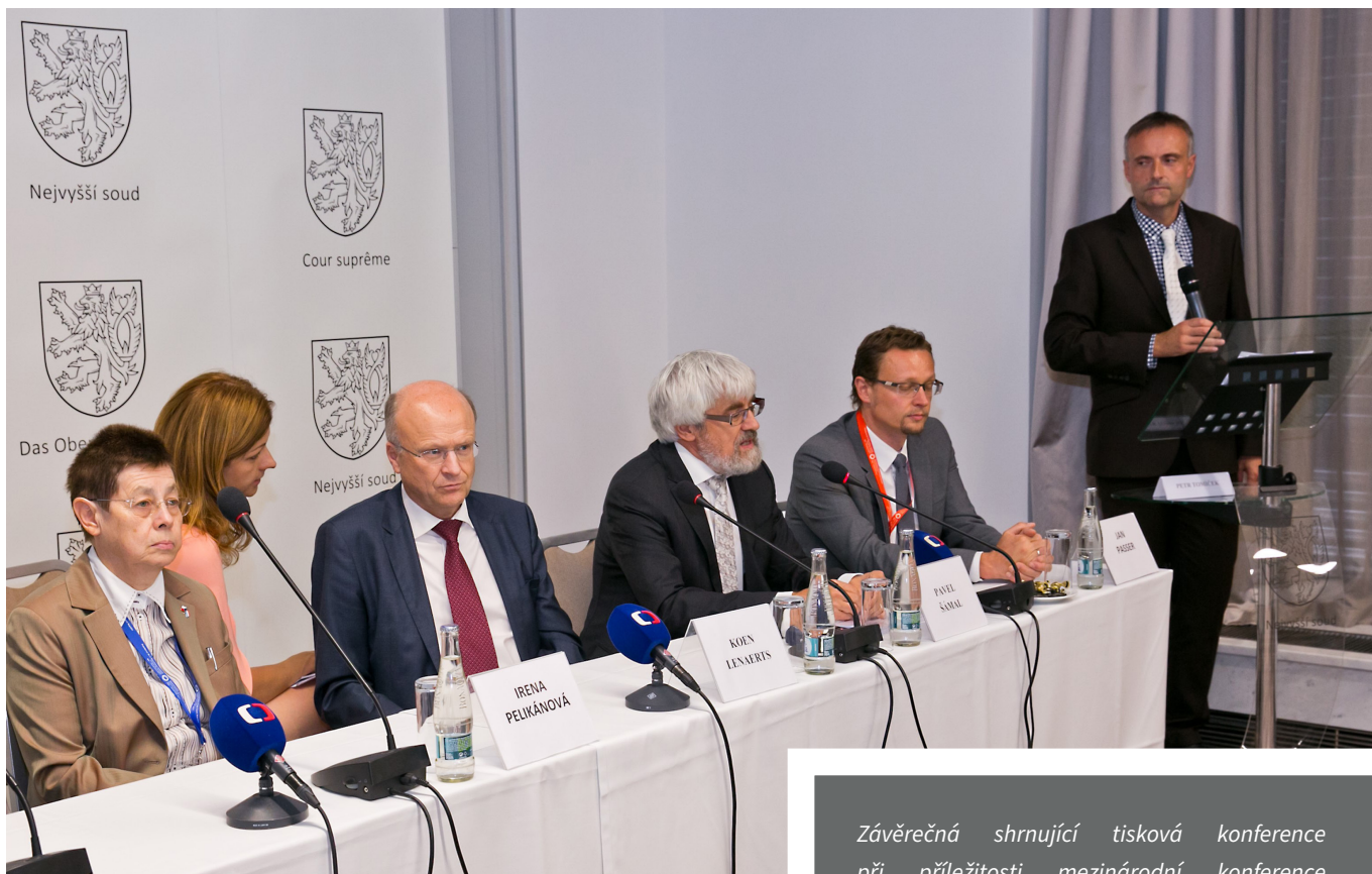
Závěrečná shrnující tisková konference při příležitosti mezinárodní konference Závaznost soudních rozhodnutí, 21. 6. 2017.