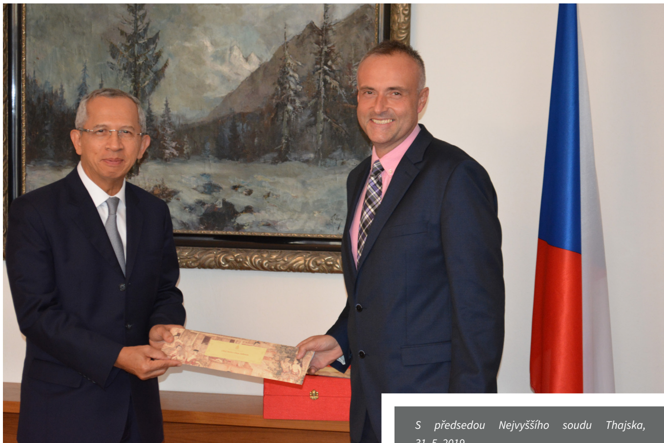
S předsedou Nejvyššího soudu Thajska, 31. 5. 2019.